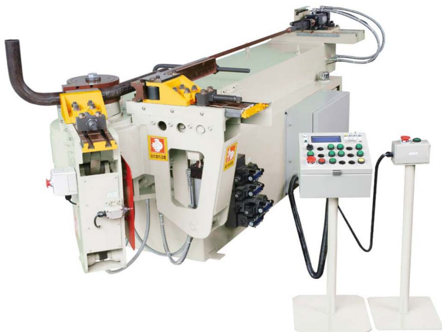
HANC型パイプベンダー